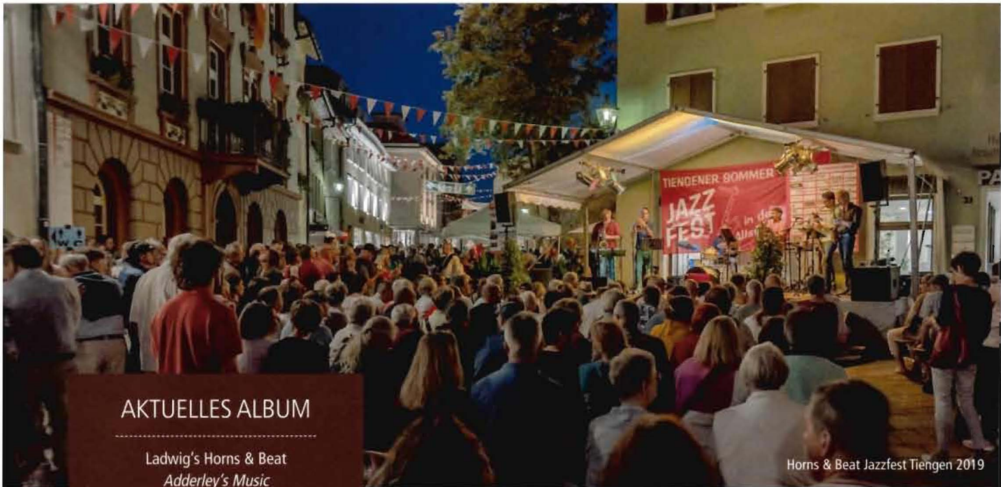
Horns & Beat Jazzfest Tiengen 2019