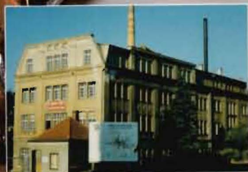
VEB B & S JAZZHORN TEIL III