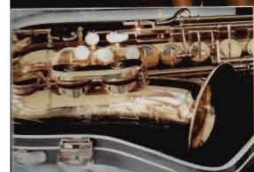
HERB COUF VOM MUSIKER ZUM SAXBAUER

Kenny Rampton Trumpet Plunger Shires TRQ10S B-Trompete Rota Trumpet Spinner Monke Mundstücke GH1 & GH2 Lechgold QP-17GL Posaune Bassetthorn