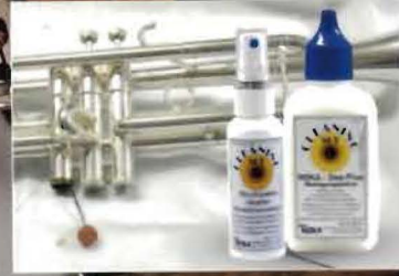
REKA HELFERLEIN ZUM REINIGEN