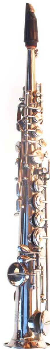
Soprasaxofon in C von Birker. Aufgelötete Tonlöcher, zwei manuell zu bedienende Oktavklappen, bis Eb 3 , vernickelt, Baujahr unbekannt. Das Instrument verfügt über eine Korrekturklappe für D 2 /Eb 2 /E 2 395

Birker bezog Saxofone seines früheren Arbeitgebers Kessels (siehe dort) und verbesserte diese. [193]