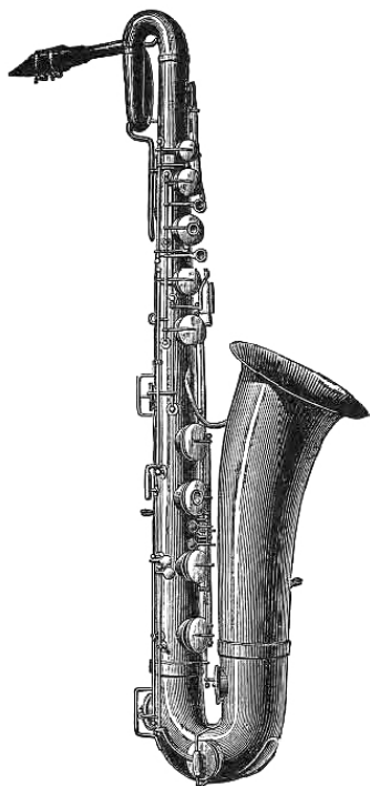
Aus einem Kessels-Katalog von 1899: Eb-Bariton-Saxofon. Bemerkenswert ist die zum Spieler gewundene Schleife oben. [193]

Ein Katalog von 1899 führt die Bautypen Eb-Sopranino, Bb-Sopran, Eb-Alto, Bb-Tenor, Eb-Bariton und Bb-Bass (als „Contre basse“ bezeichnet) auf. Als Markennamen wurden „Célesta“, „Sirena“, „Eola“ und „Corona“ verwendet. [7] [193].