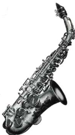
Gebogenes Sopran aus Katalog Nr. 71 [109]. Später wurde auch ein gerades C-Sopran als Ersatzinstrument für Oboe-Parts angeboten [110].

Um 1917/18 wurde Gronert's Elkhart Musical Instrument Co. (siehe dort) übernommen und Gronert angestellt.