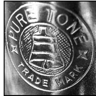
„Pure Tone“ Logo

Die Saxofone haben typischerweise gebördelte Tonlöcher, ein Front-F und sind teilweise mit einer Stimmschraube am S-Bogen und einem geriffelten G#-Drücker ausgestattet.